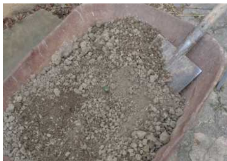
Terre argileuse du site, contrôlée et tamisée