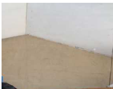
Enduit argile du site