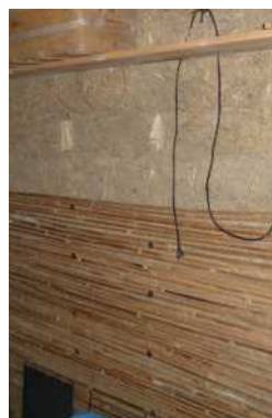
Support enduit bambou