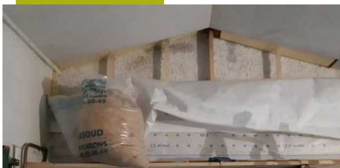
Fibre de bois vrac recyclé + support enduit frein vapeur hygro-variable